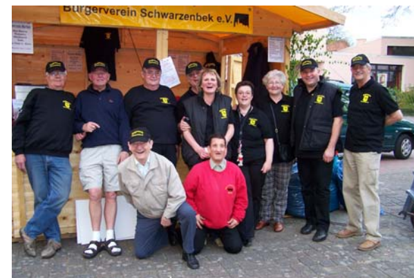
Teile des Vorstandes, der AG Veranstaltung und einige fleißigen „Helfer“ vor unserer Marktbooth