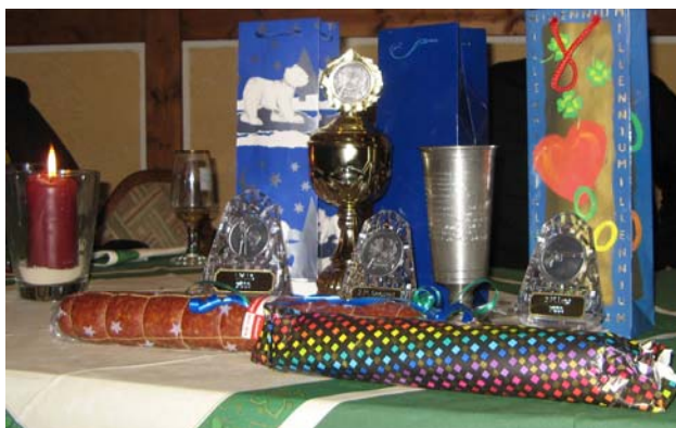
Pokale & Preise, u. a. 1. Platz der Mannschaften beim Neujahrsschiessen der Gilde 2009