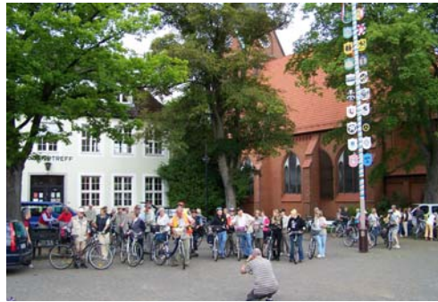
Start der Radtour 2009 auf dem Alten Markt

Unter dem Motto EINMISCHEN – MITMISCHEN – ZUSAMMENFÜHREN sehen wir uns als Mittler zwischen den Bürgern und Institutionen. Wir pflegen Kontakte zur Stadtverordnetenversammlung, zur Stadtverwaltung, zu Politikern und Parteien sowie natürlich auch zu anderen Vereinen und Verbänden.