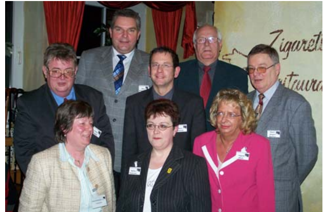
Foto des aktuellen Vorstandes